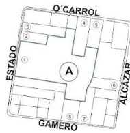
FUSIÓN DE LOTES PROPUESTA NUEVO LOTE 1 MANZANA "A"